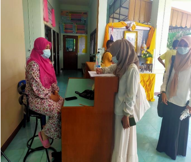
แจ้งลงชื่อผู้มาติดต่อราชการ