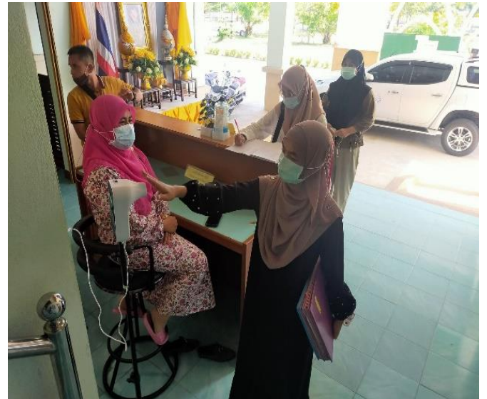
วัดอุณหภูมิร่างกาย